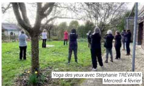
Yoga des yeux avec Stéphanie TRÉVARIN Mercredi 4 février