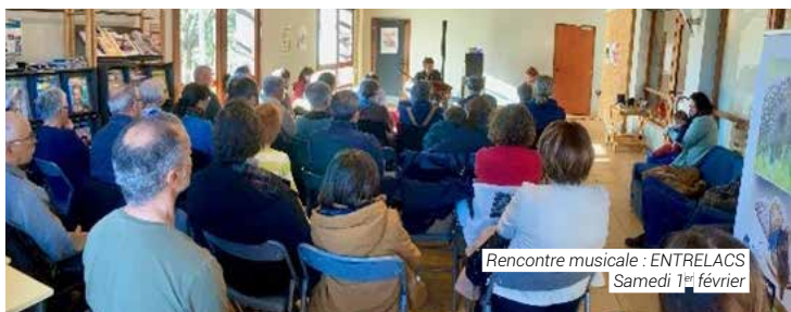
Rencontre musicale : ENTRELACS Samedi 1 er février