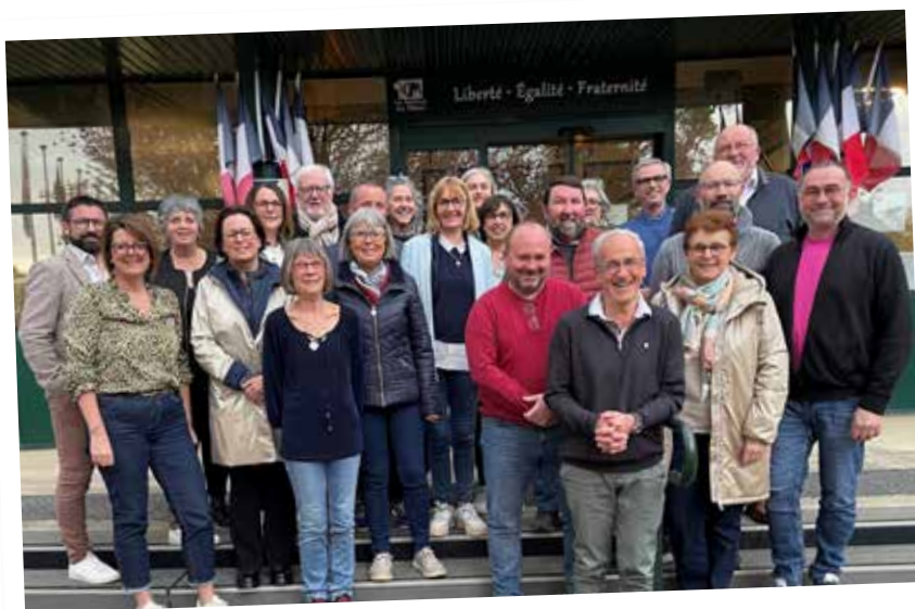
Le Conseil Municipal, le 02/04/2025