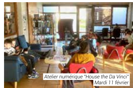
Atelier numérique "House the Da Vinci" Mardi 11 février