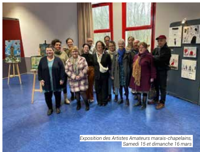
Exposition des Artistes Amateurs marais-chapelains, Samedi 15 et dimanche 16 mars