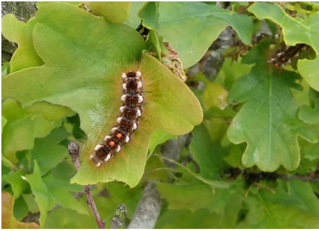
Chenille au stade L5