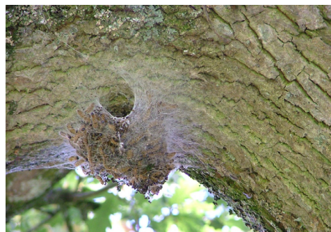
Cocon sur un chêne

La chenille processionnaire du chêne est issue d'un papillon nocturne inféodé aux chênes. Cette espèce peut causer d'importants dommages par défoliation et possède des poils urticants pouvant entraîner des réactions allergiques chez l'Homme et les animaux. D'aspect grisâtre avec la tête noire, cette chenille est fortement velue.