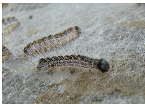
Chenille au stade L4