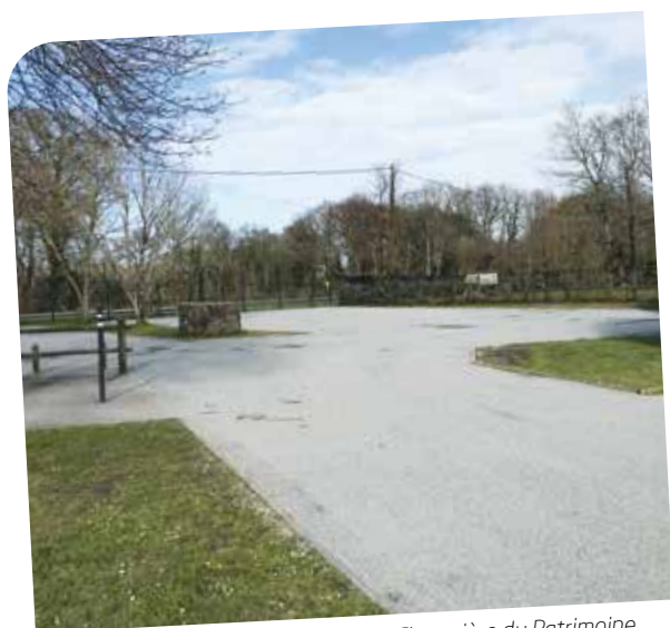
Réfection bi-couche - Parking La Chaumière du Patrimoine

Un enduit superficiel est fabriqué dans les raffineries. Il se compose de deux couches superposées (une fine couche d'émulsion de bitume et d'eau qui fait office de liant ou colle, et d'une couche de gravier). Cette opération peut être répétée d'où l'appellation mono couche, bi-couche, tri-couche. On l'utilise sur des surfaces moins sollicitées, et a aussi l'avantage d'être renouvelé plus facilement par rechargement.