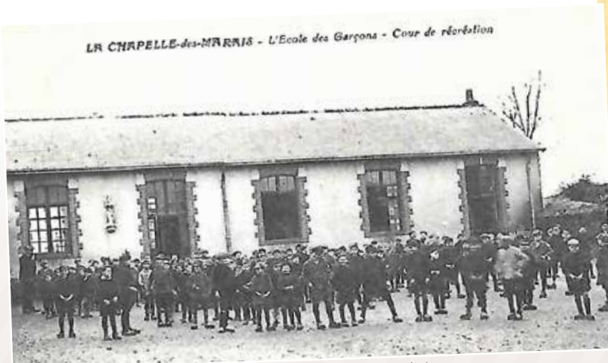
École privée Garçons 1913 - Cour de récréation

Enfin, après plus d'une centaine d'années, la guéguerre était terminée et nous pouvons dire que la CHAPELLE DES MARAIS est une commune apaisée. »