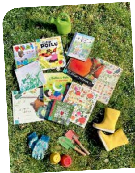
Des histoires pour prolonger le plaisir du potager.

Plus tôt l'enfant est sensibilisé à la nature, plus tôt il aura envie de la protéger. Prêts ? À vos potagers !