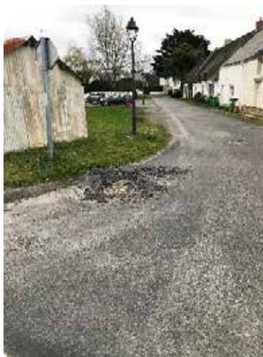
Rue de la Barberaie avant travaux...

Nous avons décidé récemment de refaire le parking de l'espace la chaumière pour réduire très fortement les interventions des