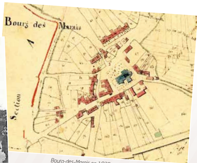
Bourg-des-Marais en 1825 (Wikipedia.org)